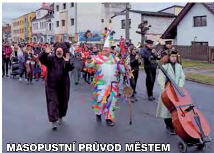
MASOPUSTNÍ PRŮVOD MĚSTEM