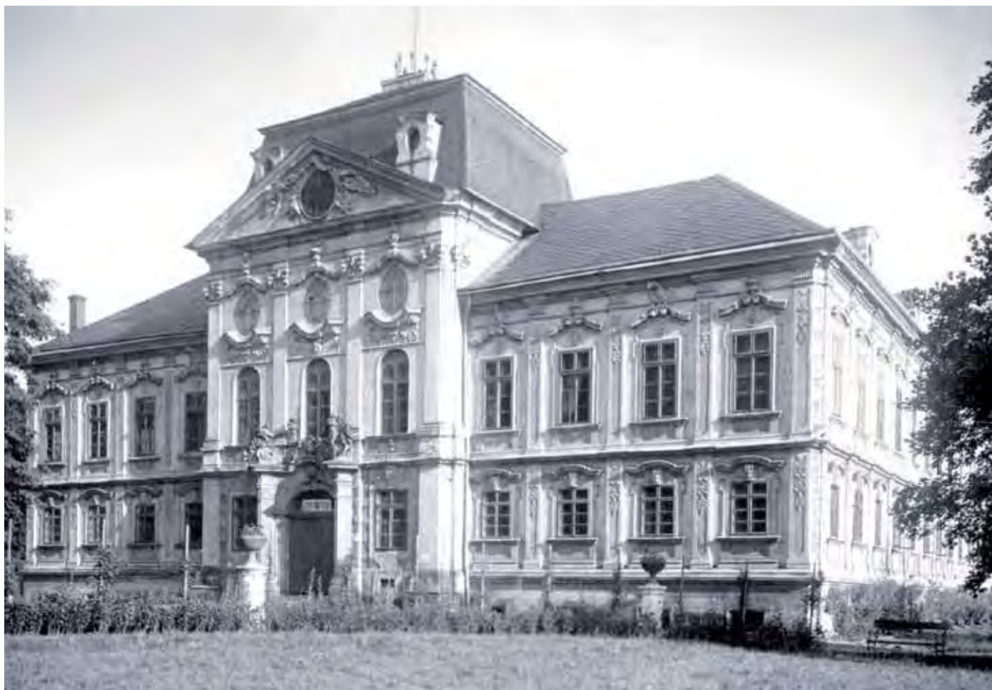
Kravařský zámek, 20. – 30. léta 20. století.

První písemná zmínka o Kravařích pochází z první třetiny 13. století, konkrétně z roku 1224. Objevuje se v listině, kterou český král Přemysl Otakar I. uděluje některá městská práva městu Opavě.